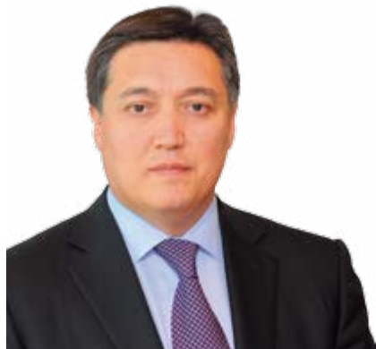
Президент АО «НК «Қазақстан темір жолы» АСКАР МАМИН